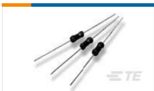
TE 产品编号6-1625892-8 3W SM M/OX 5% 6K8