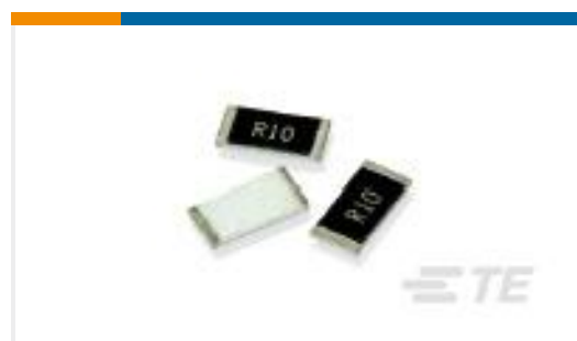
TE 产品编号3-2176058-7 RLP73K 3A R33 5% 2K RL