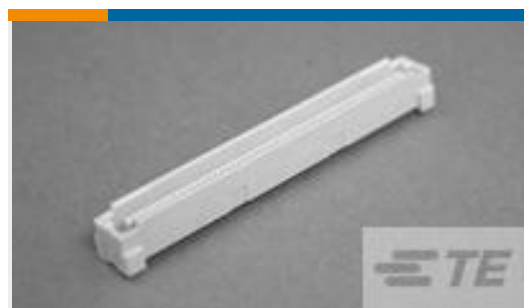
TE 产品编号1-5177986-1 0.8FH,P06H.5,040,08/Sn,TR,SC