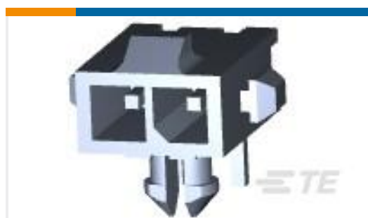
TE 产品编号2-1445098-2 MICRO MNL HDR ASSY S/ROW AU LF