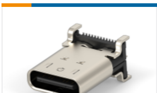
TE 产品编号2337857-1 VERTICAL USB TYPE-C REC