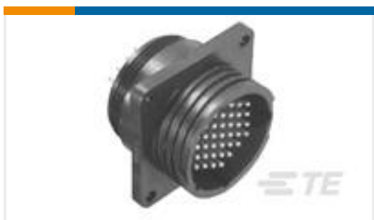
TE 产品编号208223-9 CPC RECPT ASSEMBLY SIZE 13-9