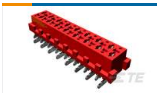
TE 产品编号7-188275-8 MICRO-MATCH SMD FTE