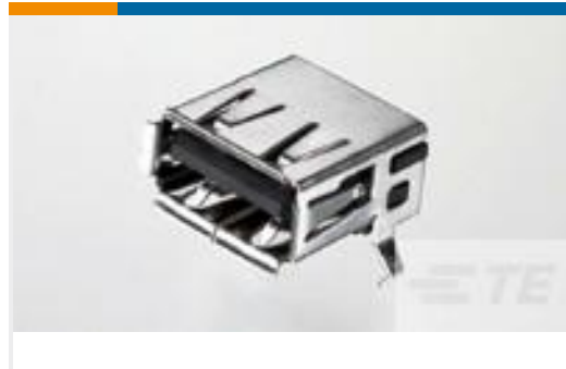
TE 产品编号292303-3 Std USB Type A, R/A, T/H, Natural