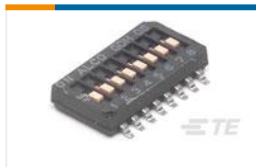
TE 产品编号1571983-1 GDH02S04=DIP SWITCH