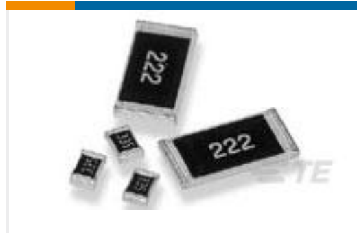
TE 产品编号1623232-1 CRG0805 1% 470R