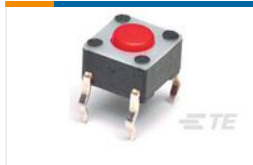
TE 产品编号1825910-2 FSM2JH=6MM TACT SWITCH, HIGH TEMP