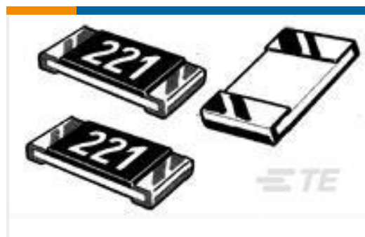
TE 产品编号1-2176230-3 3522 8R2 5% 3W