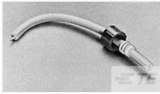
TE 产品编号1-830611-0 LGH 1/2 SNGL MLD END