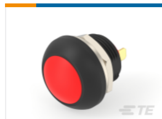
TE 产品编号2329360-2 PB OFF/ON RC RED M1 TERM. IP68