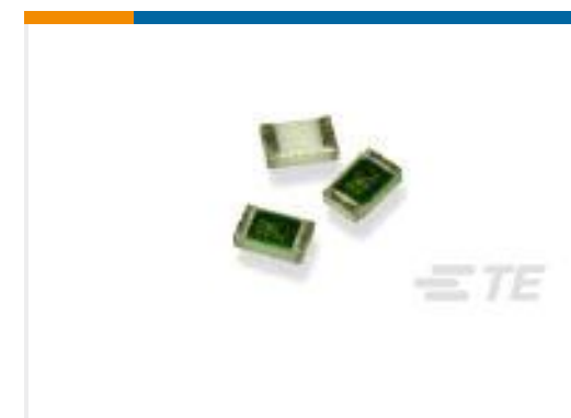
TE 产品编号1879217-5 CPF 0603 200K 0.1% 25PPM 1K RL