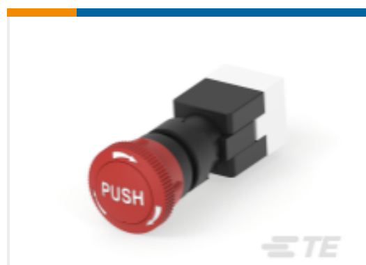
TE 产品编号2381881-3 PBES16 23.8 RB NO LAMP 1NC 1NC