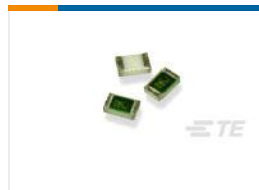
TE 产品编号7-1879215-9 CPF 0402 30K1 0.1% 25PPM 1K RL