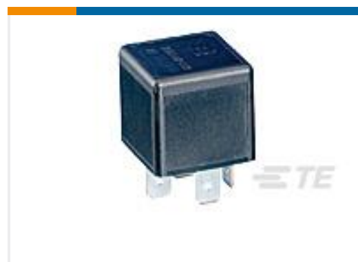
TE 产品编号1393303-9 V23134B0053C642-EV-CBOX