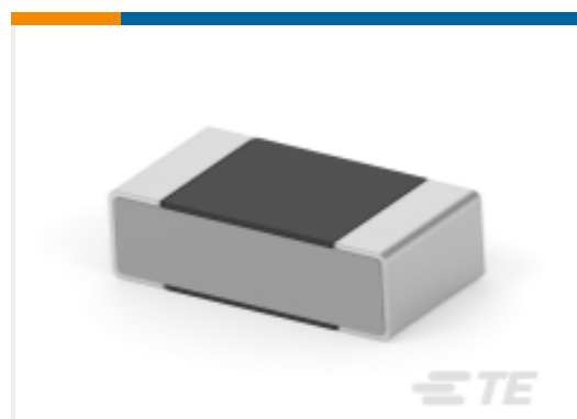
TE 产品编号1879207-7 RN 0603 232K 0.1% 10PPM 5K RL