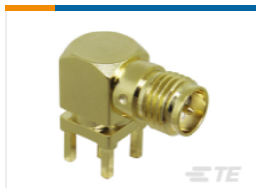
TE 产品编号CONREVSMA002-G RP-SMA RA Jack 50 Ohm PCB Through Hole