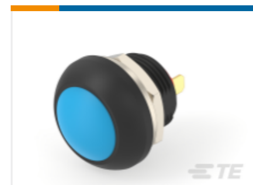
TE 产品编号2329360-5 PB OFF/ON RC BLU M1 TERM. IP68