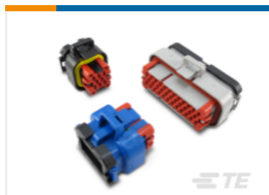
TE 产品编号776273-2 AMPSEAL 母端护套