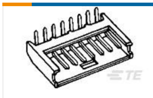
TE 产品编号280379-2 6P MODU II SHRD HDR, RT ANG, 0.38 AU