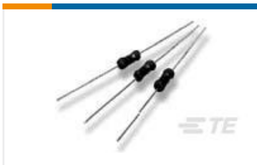
TE 产品编号2-1625885-7 1W SM M/OX 5% 180R