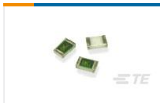
TE 产品编号1676228-2 RN 0805 1K27 0.1% 10PPM 1KRL