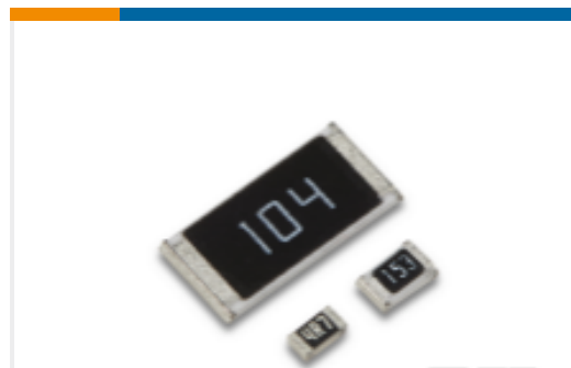
TE 产品编号1-2176339-9 CRGCQ 0603 330R 1%