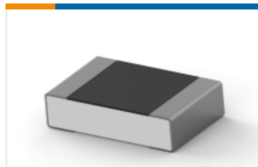
TE 产品编号9-2176374-4 RQ 0805 1K0 0.1% 10PPM 1K RL