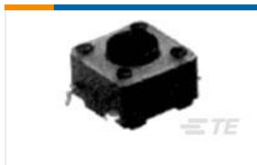
TE 产品编号1571563-4 FSM4JSMAATR=TACTSWITCH,SMT, T&R