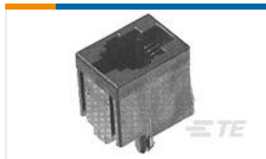
TE 产品编号5556416-1 MJ,TE,8P