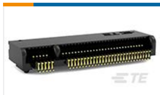
TE 产品编号1-2199119-5 M.2 0.5PITCH 3.2H KEY M 15U" AU