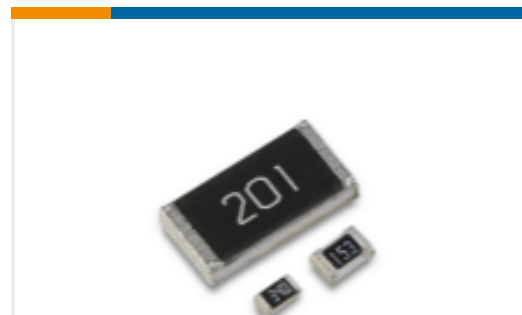
TE 产品编号2-2176329-5 CRGP 1210 1K0 1%