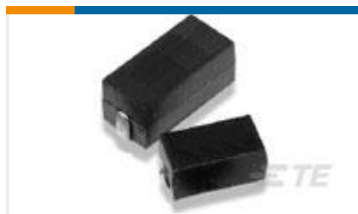
TE 产品编号2-1879011-5 SMF2 2K2 5%