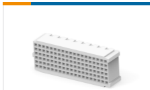
TE 产品编号2355825-1 Mezalog, Socket, 114 p, 10 mm, 50 Au,