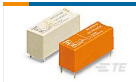
TE 产品编号4-1393224-2 RY211005