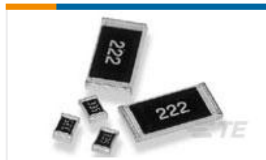
TE 产品编号1623169-1 CRG0805 1% 270R