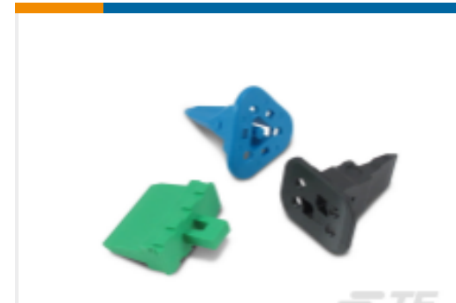
TE 产品编号W2S Wedge locks: DEUTSCH DT