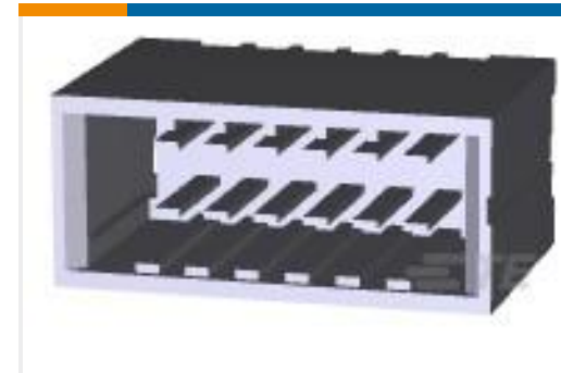
TE 产品编号178326-2 DYNAMIC DBL ROW HDR ASSY 12P V