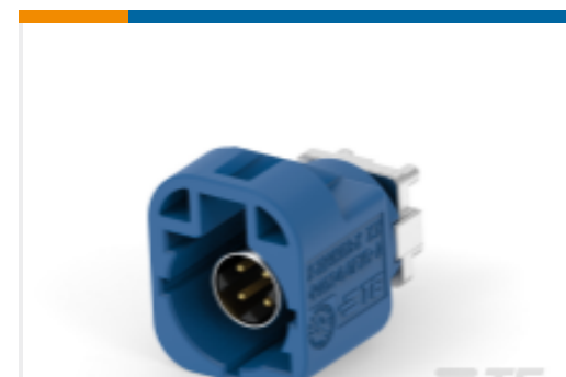
TE 产品编号2291364-3 4POS,PIN DIA 0.6,HEADER ASSY, CODE C