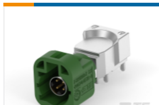
TE 产品编号2291362-5 4POS,PIN DIA 0.6,HEADER ASSY, CODE E