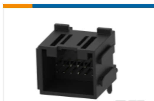
TE 产品编号2322613-1 12POS,TAB0.63X0.63,HDR ASSY, 180DEG,SLDR