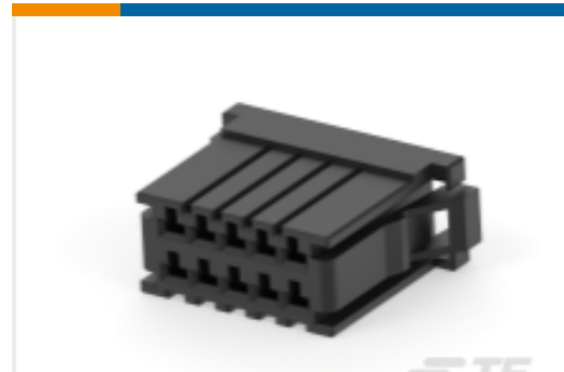
TE 产品编号178803-5 Receptacle and Tab Housing: 3.81 mm pitch, 250V