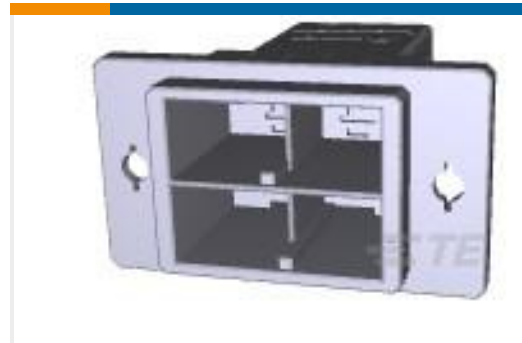
TE 产品编号3-917809-2 DYNAMIC D-5 TAB HSG D/R 4P X-Y