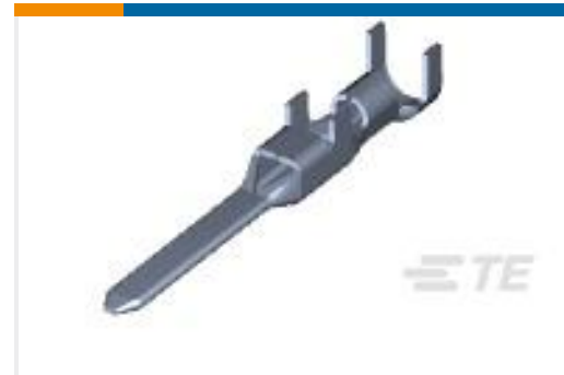
TE 产品编号175289-3 DYNAMIC D-3 TAB CONT. L AU 0.76 L /P