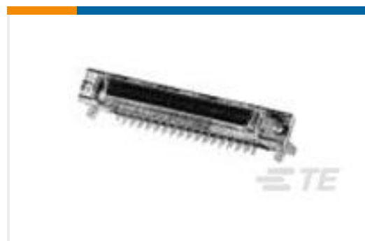
TE 产品编号5787190-1 20 50SR R/A RCPT ASSY,RDSN L/F