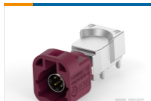
TE 产品编号2291362-4 4POS,PIN DIA 0.6,HEADER ASSY, CODE D