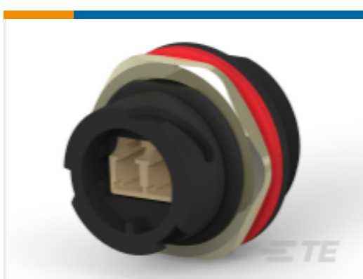
TE 产品编号 1828619-1 Kit,Receptacle,LC, ODVA,MM