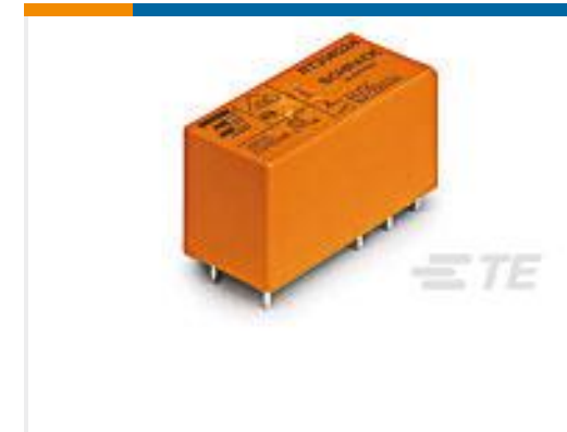
TE 产品编号1649357-4 RTH14012