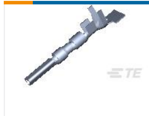
TE 产品编号1-794221-0 MINI UMN2 SOK 22-18AWG AU LF