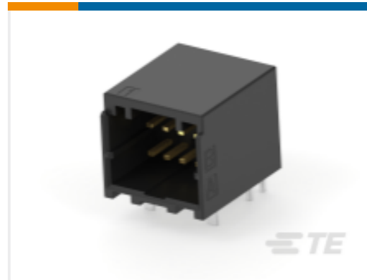
TE 产品编号1-1827873-5 Header Assembly: Wire-to-Board, 3A, Gold or Tin Plated