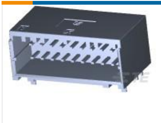
TE 产品编号1-1827876-0 DYNAMIC 1200D HDR ASSY H 20PX BLACK GOLD