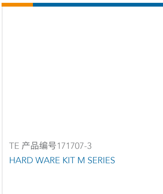
TE 产品编号171707-3 HARD WARE KIT M SERIES