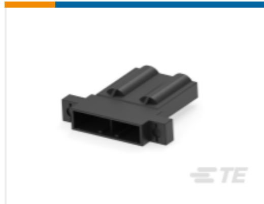
TE 产品编号1-2352216-2 DYNAMIC D8000 TAB HSG 2P