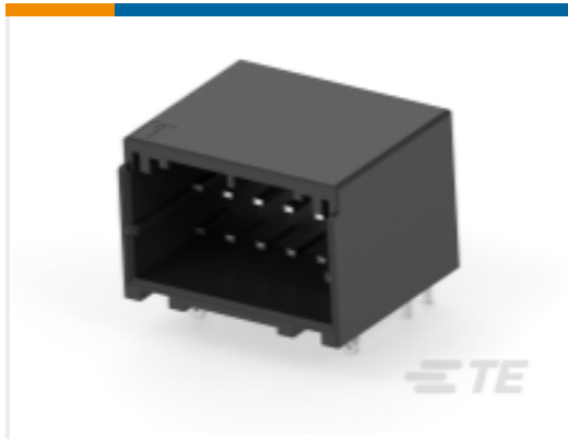
TE 产品编号1-1827876-4 Header Assembly: Wire-to-Board, 5A, gold or tin plated