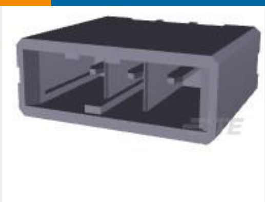
TE 产品编号1-178136-2 DYNAMIC D3200 HDR V ASSY 3P