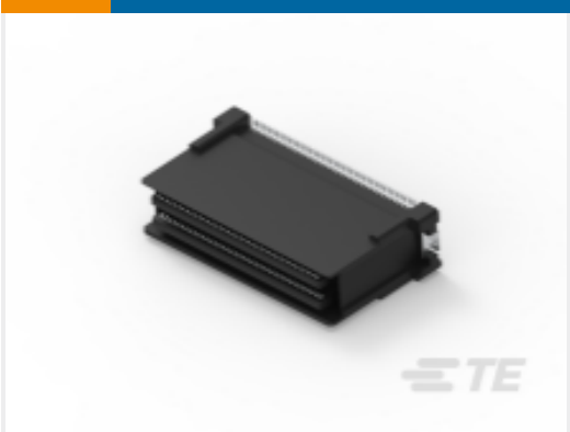
TE 产品编号1554218-1 MICRO STACK HDR ASSY 8OP H=16

DYNAMIC 1200D HDR ASSY V 16PX BLACK GOLD