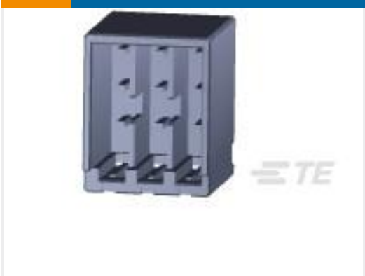
TE 产品编号1-1827581-3 DYNAMIC 1500T HDR ASSY V 9P X BLACK GOLD