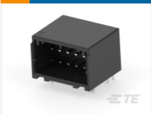
TE 产品编号1-1827876-6 Header Assembly: Wire-to-Board, 5A, gold or tin plated