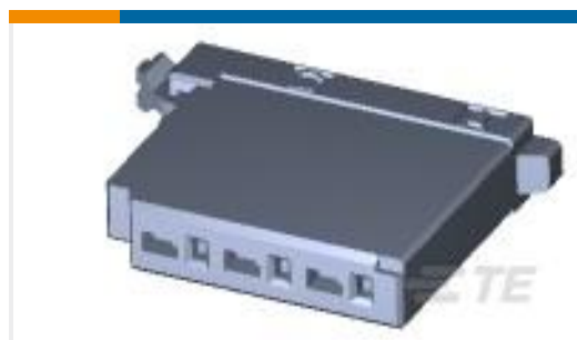
TE 产品编号1-1827579-1 DYNAMIC 1500T REC HSG 3P X BLACK