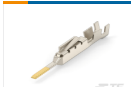
TE 产品编号1318112-1 Contact: Component To Wire ; 5A, 28- 18 wire size, gold plated