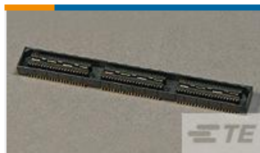
TE 产品编号2-1658012-3 MSB0.80RC-ASY120FL,-,10,-TY