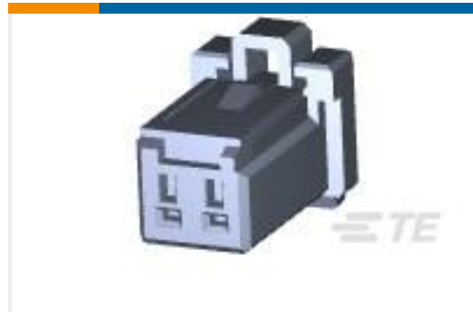
TE 产品编号1-1871465-2 DYNAMIC 1200S REC HSG 2P X BLA