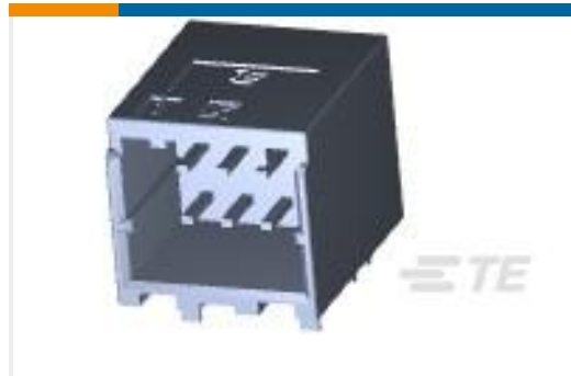
TE 产品编号1-1827876-4 DYNAMIC 1200D HDR ASSY H 8PX BLACK GOLD