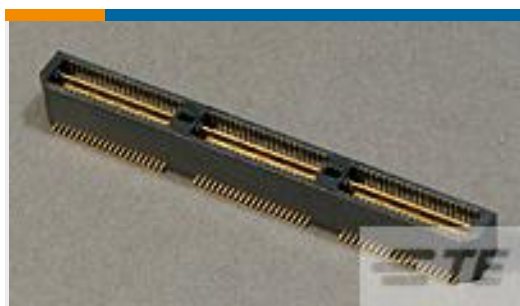
TE 产品编号1658014-3 MSB0.80PL8ASY120FL,-,10,-TY