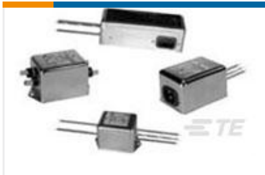
TE 产品编号6609048-9 20EQ1 M0=F7776