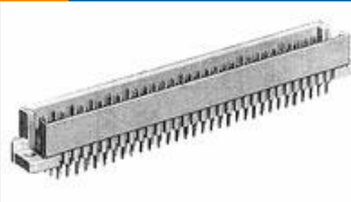
TE 产品编号536019-5 096 EURO TYP R PIN AP MFBL ASY