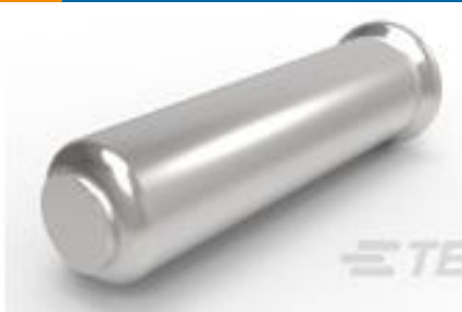
TE 产品编号3-5332070-5 SOCKET,MIN-SPR W/KO SN-AU S-4