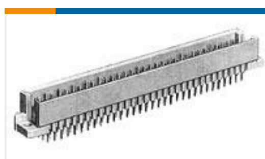
TE 产品编号536019-5 096 EURO TYP R PIN AP MFBL ASY