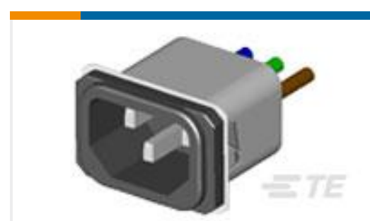
TE 产品编号5-1609987-6 15SRBX8=F8287