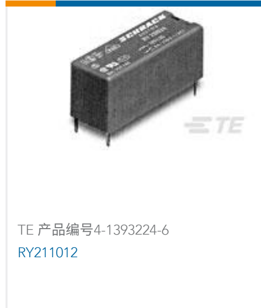
TE 产品编号4-1393224-6 RY211012