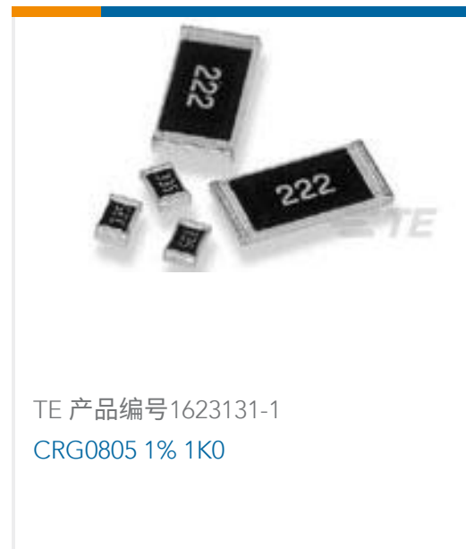
TE 产品编号1623131-1 CRG0805 1% 1K0