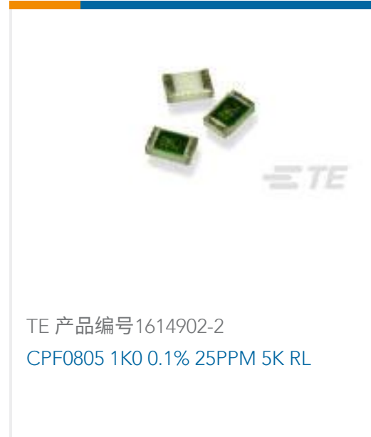
TE 产品编号1614902-2 CPF0805 1K0 0.1% 25PPM 5K RL