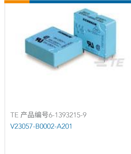
TE 产品编号6-1393215-9 V23057-B0002-A201