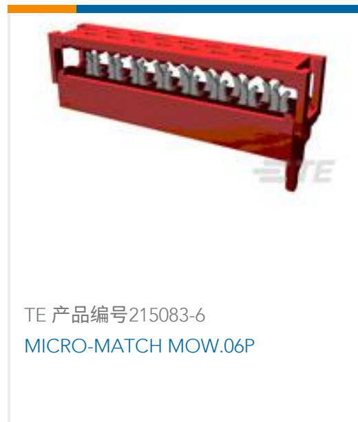
TE 产品编号215083-6 MICRO-MATCH MOW.06P