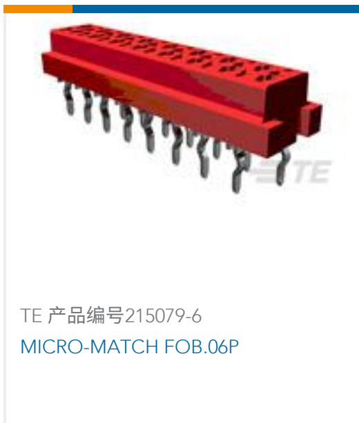
TE 产品编号215079-6 MICRO-MATCH FOB.06P