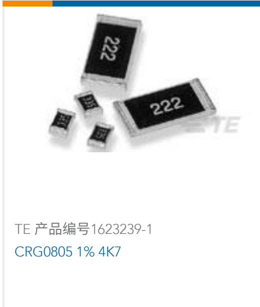
TE 产品编号1623239-1 CRG0805 1% 4K7