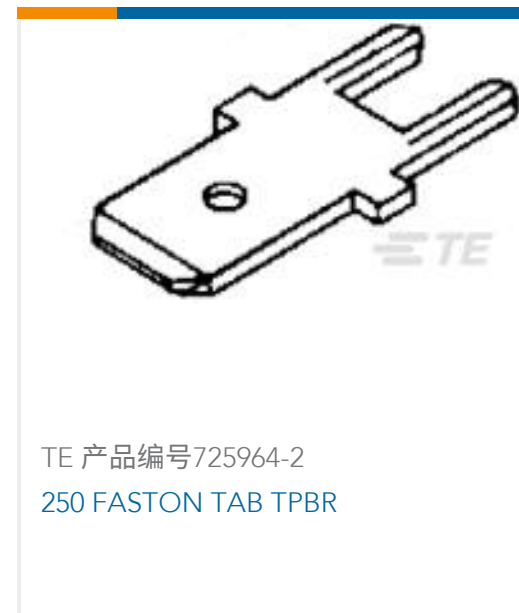
TE 产品编号725964-2 250 FASTON TAB TPBR