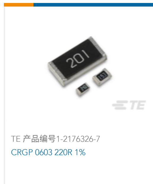
TE 产品编号1-2176326-7 CRGP 0603 220R 1%