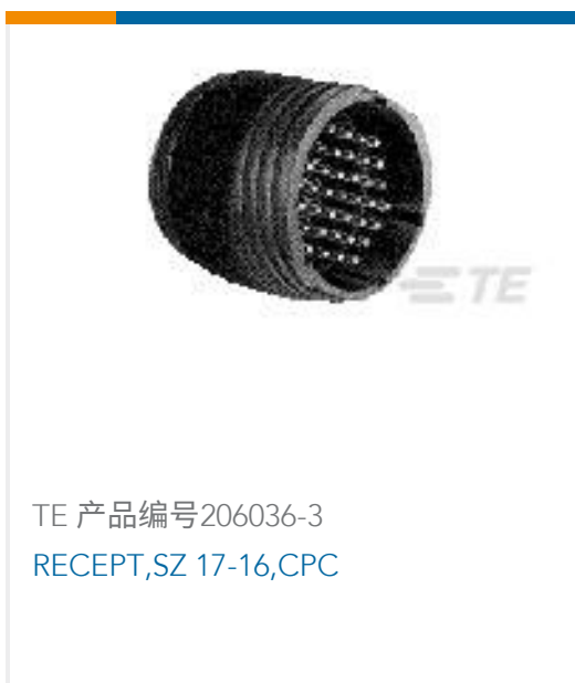
TE 产品编号206036-3 RECEPT,SZ 17-16,CPC