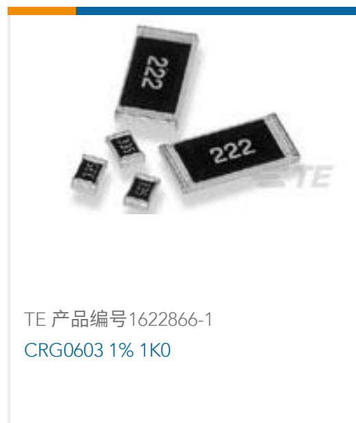
TE 产品编号1622866-1 CRG0603 1% 1K0