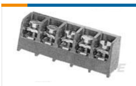
TE 产品编号3-1546159-1 6WWV-11-008=#6 TRIBARRIER TERM