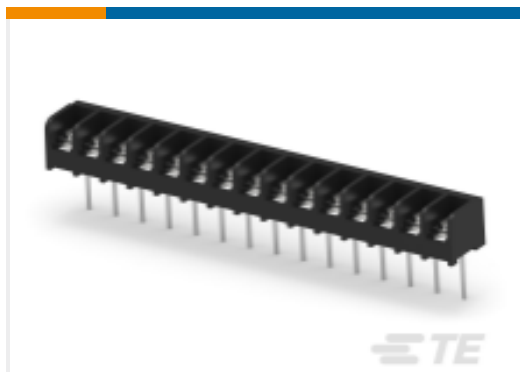
TE 产品编号2-796608-3 6WWV-15-008=#6 TRIBARRIER