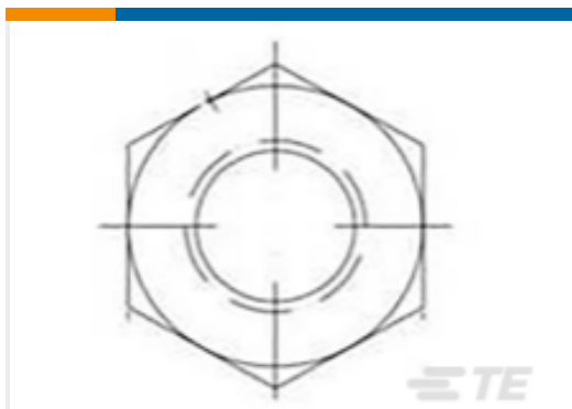
TE 产品编号1-328690-2 JAM NUT, GOLD PLATED