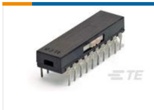
TE 产品编号6-1825011-4 ASF62RG04=6PDT AUTOSLIDE