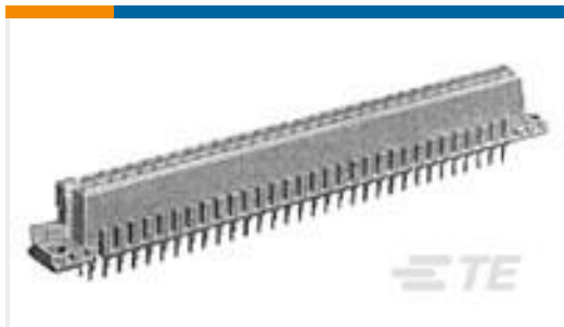
TE 产品编号5650858-5 ASSEMBLY,RECEPTACLE,EUROCARD, T