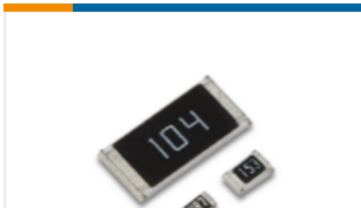
TE 产品编号2176349-7 CRGCO 2512 33R 1%