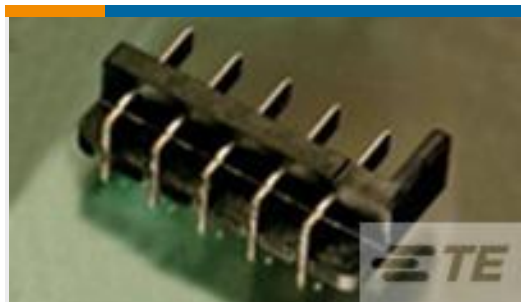
TE 产品编号5787422-1 HDR ASY,RA,RKEY,STR TAIL,12.0V