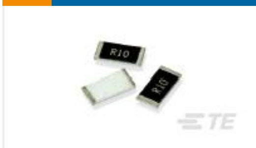
TE 产品编号2-1622824-0 RL73H 2B R33 1% 5K RL