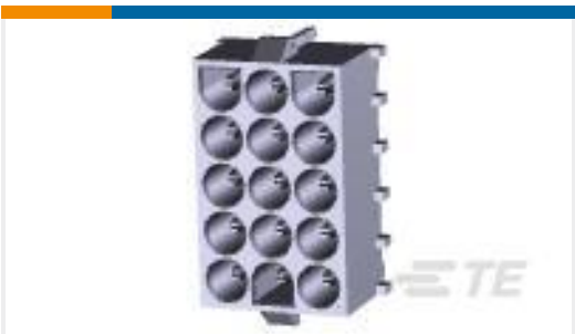
TE 产品编号641976-1 15P UMNL PIN HDR ASSY POL 94VO