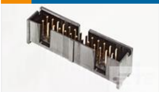
TE 产品编号2-1761603-9 IDC LOW PRO HDR 26P VERT BLUE