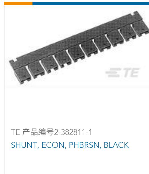
TE 产品编号2-382811-1 SHUNT, ECON, PHBRNS, BLACK