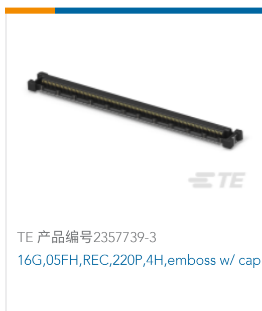
TE 产品编号2357739-3 16G,05FH,REC,220P,4H,emboss w/ cap