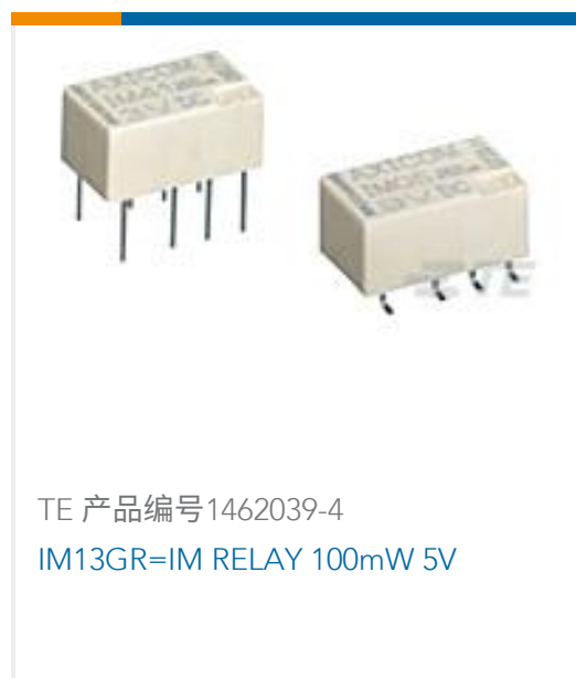
TE 产品编号1462039-4 IM13GR=IM RELAY 100mW 5V