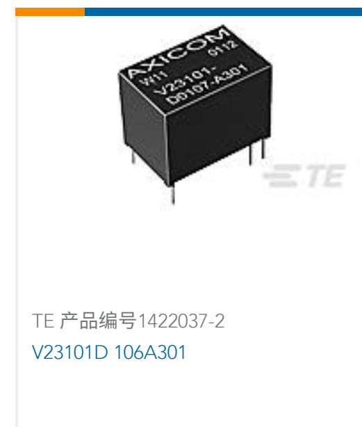
TE 产品编号1422037-2 V23101D 106A301