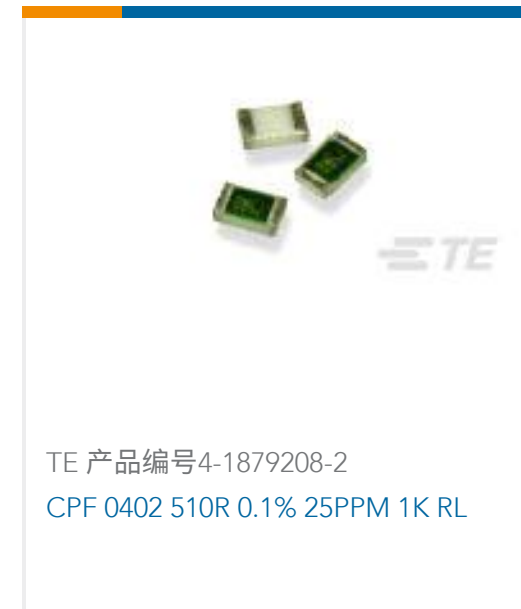
TE 产品编号4-1879208-2 CPF 0402 510R 0.1% 25PPM 1K RL