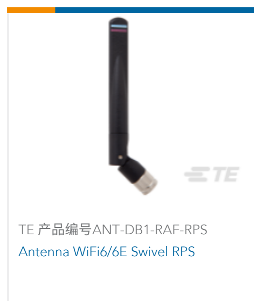
TE 产品编号ANT-DB1-RAF-RPS Antenna WiFi6/6E Swivel RPS