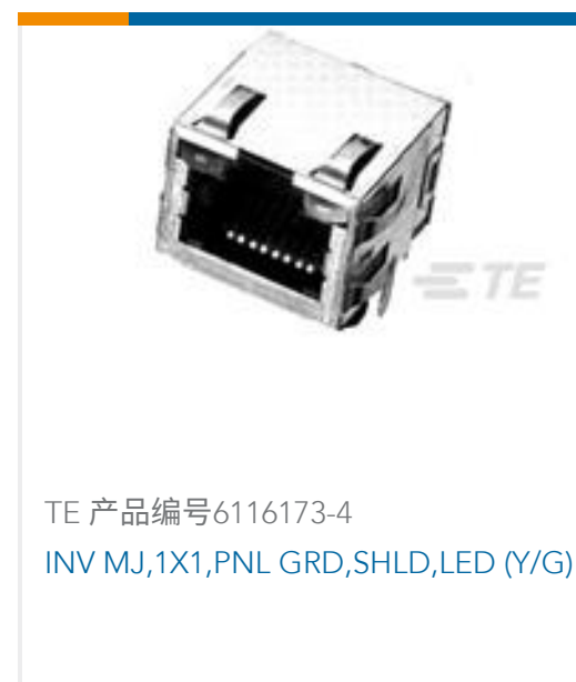
TE 产品编号6116173-4 INV MJ,1X1,PNL GRD,SHLD,LED (Y/G)