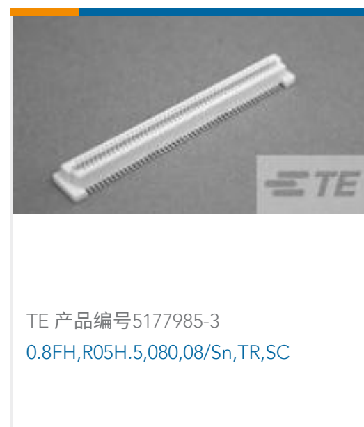
TE 产品编号5177985-3 0.8FH,R05H.5,080,08/Sn,TR,SC