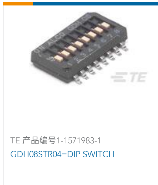
TE 产品编号1-1571983-1 GDH08STR04=DIP SWITCH