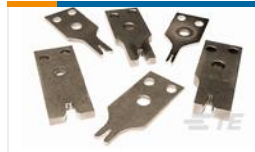
TE 产品编号1633962-7 CRIMPER, INSULATION F PREMIUM