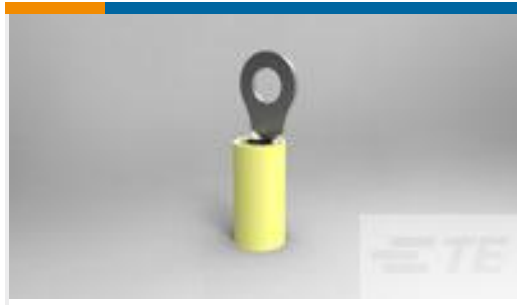
TE 产品编号2-324075-1 TERMINAL,PIDG R 26-22 10