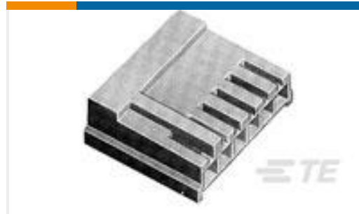
TE 产品编号2-171822-3 EIS REC. HSG 3P-BLACK