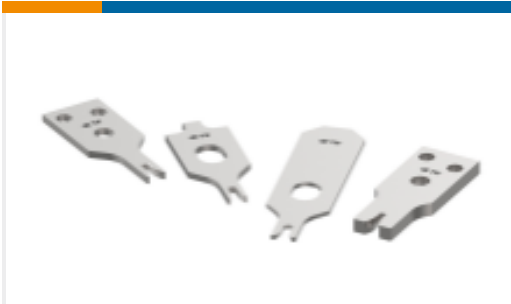
TE 产品编号1803323-2 CRIMPER, WIRE, F PREMIUM