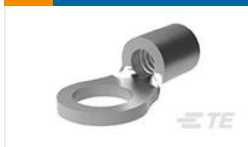
TE 产品编号1-320765-0 TERMINAL,SOLIS R 12-10 1IN.