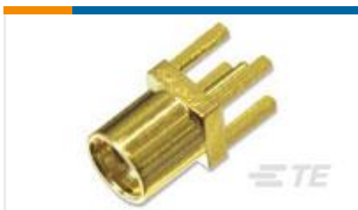
TE 产品编号1-1634009-0 MMCX Str PCB Skt 50Ohm Gold Pl