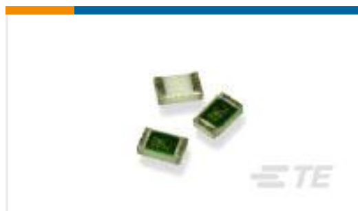
TE 产品编号1-1614884-5 CPF 0805 8R2 0.1% 25PPM 1K RL