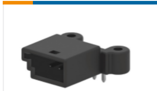
TE 产品编号1318382-4 Signal Header