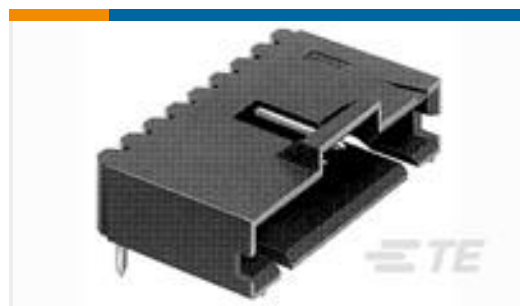
TE 产品编号103635-1 02 MTE HDR SRRA LATCH .100CL