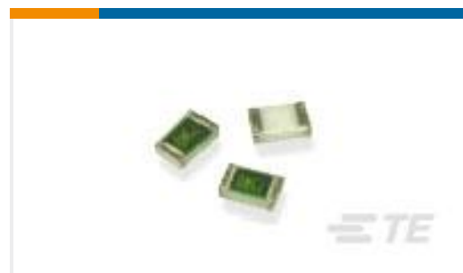
TE 产品编号7-2176088-6 RP 1J 0.166W 5K49 0.1% 25PPM 1K RL