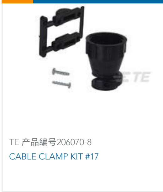
TE 产品编号206070-8 CABLE CLAMP KIT #17