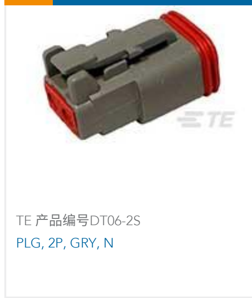
TE 产品编号DT06-2S PLG, 2P, GRY, N