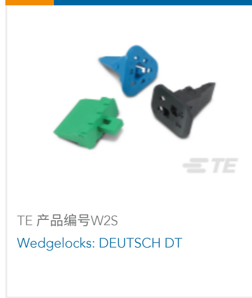
TE 产品编号W2S Wedgelocks: DEUTSCH DT