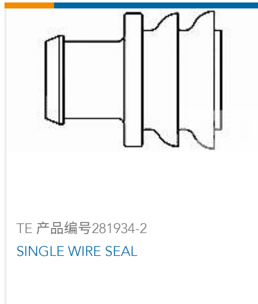
TE 产品编号281934-2 SINGLE WIRE SEAL