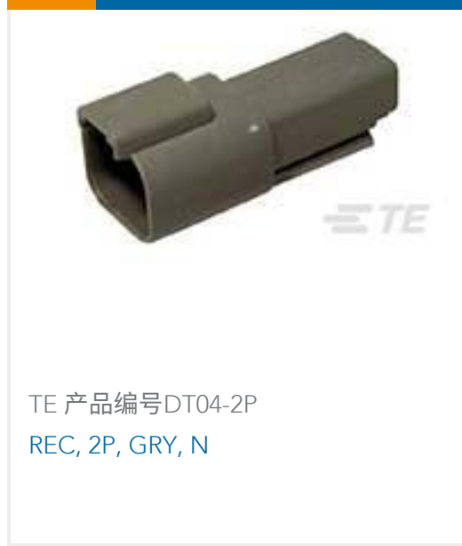
TE 产品编号DT04-2P REC, 2P, GRY, N