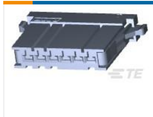
TE 产品编号1-178288-6 DYNAMIC D3100 REC HSG 6P