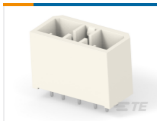
TE 产品编号172035-1 MIC CAP 9P V