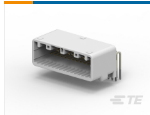
TE 产品编号1-1565373-1 025 28POS CAP ASSY H AU