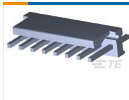
TE 产品编号644752-8 08P MTA156 HDR ASSY SQ STR F/L