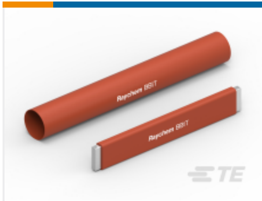
TE 产品编号560982-000 BBIT-150/60-A/U-4(S15)