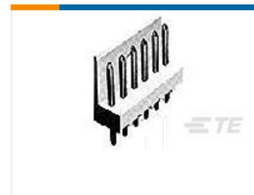
TE 产品编号171825-4 TYPE V EIS CONNECTOR 4P ASSY