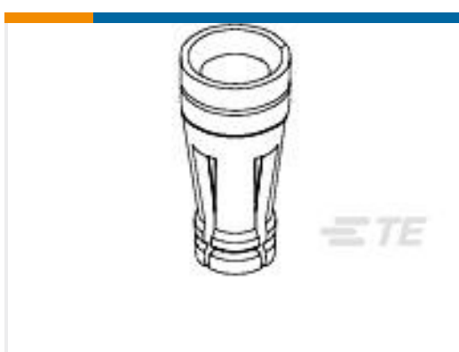
TE 产品编号6-1437514-6 8134-HC-5P2=CONTACT,AU PLT. 3.