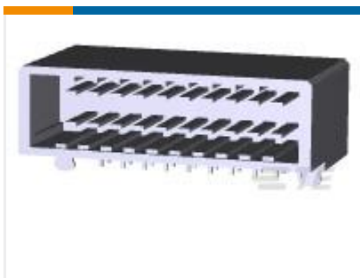
TE 产品编号178308-2 DYNAMIC D-3 HDR ASSY H 20P