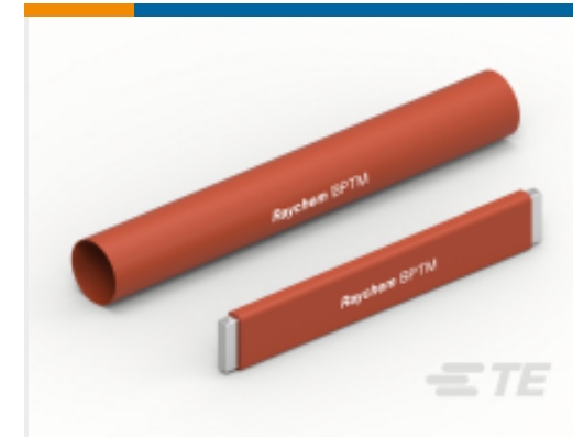
TE 产品编号178238-000 BPTM-100/40-A/U-4(S25)