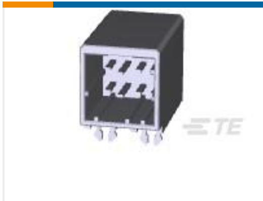
TE 产品编号1376009-1 DYNAMIC D2100 HDR H ASSY 8P X