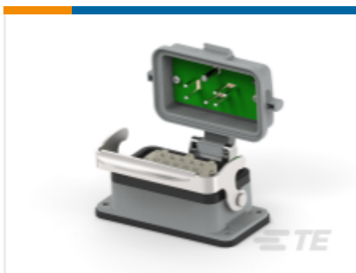
TE 产品编号T2120100217-000 ZGG-H10DST (1-2/7-8/5-10)