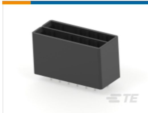
TE 产品编号3-178140-5 Header Assembly: Wire-to-Board, 15A, gold or tin plated