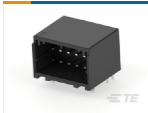
TE 产品编号1-1827875-6 Header Assembly: Wire-to-Board, 5A, gold or tin plated