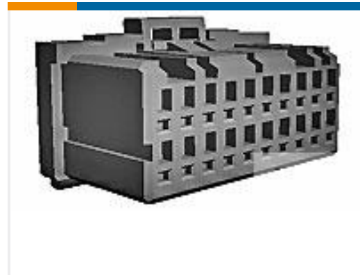
TE 产品编号9-1827864-3 DYNAMIC 1200D REC HSG 6P X BLACK