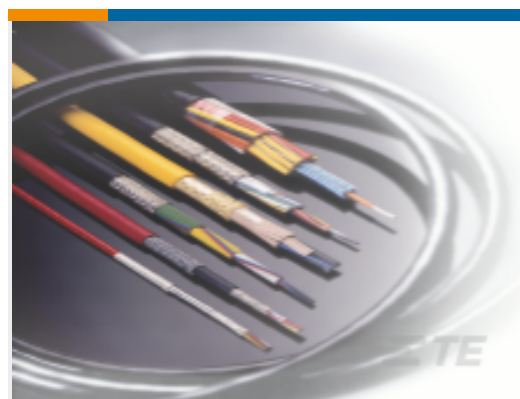
TE 产品编号4476213001 100G0111-0.5-OCK0042