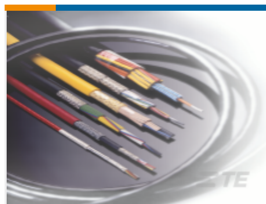
TE 产品编号CT37643001 100G0111-1.20-OCK0042