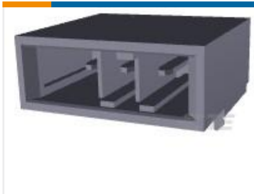
TE 产品编号1-178138-3 DYNAMIC 3200 HDR H 3P ASSY