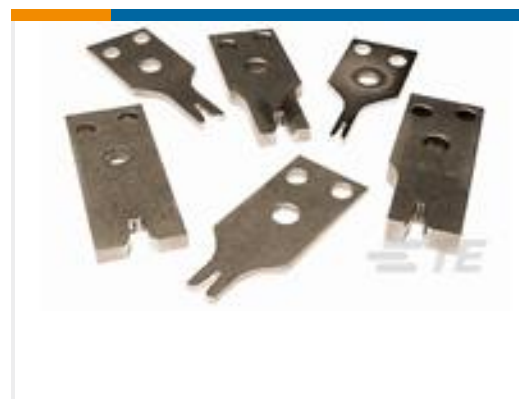
TE 产品编号913714-1 INS-CRIMPER