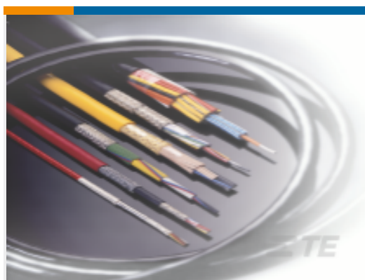
TE 产品编号2104733001 100G0111-0.75-OCK0042