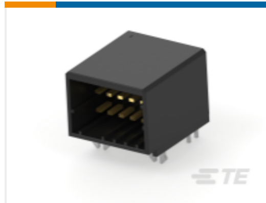
TE 产品编号1318125-1 Header Assembly: Wire-to-Board, 5A, gold plated