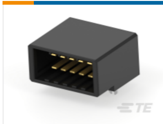
TE 产品编号1-178317-2 Header Assembly: Wire-to-Board, 15A, gold or tin plated