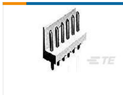
TE 产品编号171825-3 POST HEADER ASSY EI SRS 3POS