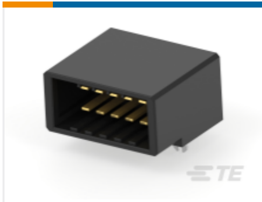
TE 产品编号1-178313-3 Header Assembly: Wire-to-Board, 15A, gold or tin plated