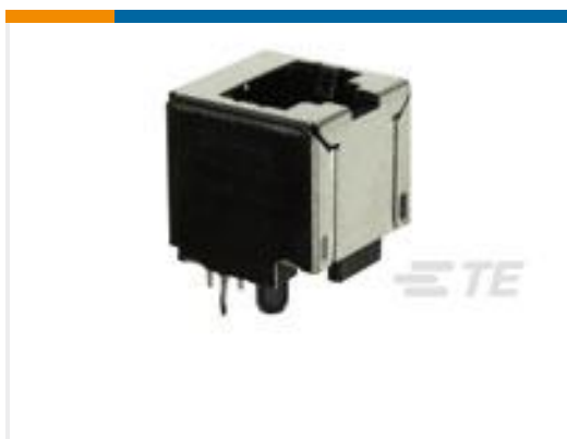
TE 产品编号6116202-1 MJ,TE,8P,COMPL.PIN,CAT5,PC