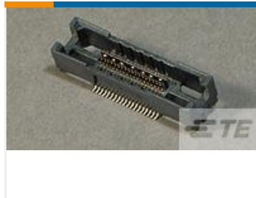
TE 产品编号2-5767004-2 MICTOR RECEPT ASSY, 38 POS.