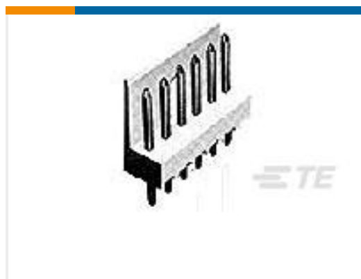
TE 产品编号171825-5 5 POS EIS POST HDR