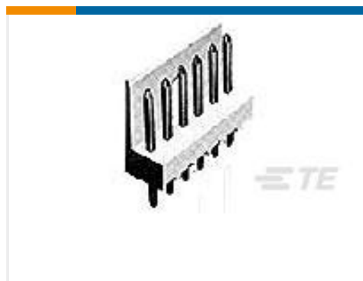
TE 产品编号171825-2 2 POS EIS POST HDR