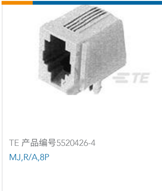
TE 产品编号5520426-4 MJ,R/A,8P