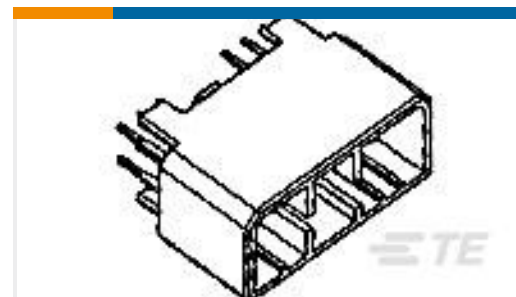
TE 产品编号1-174955-1 070 MLC CAP ASSY V 8P