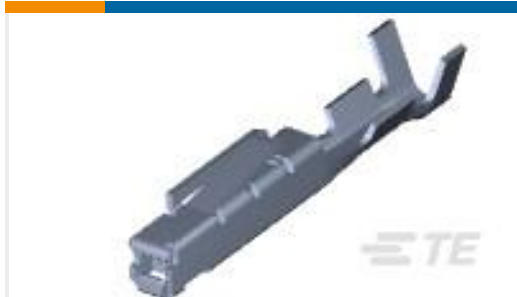
TE 产品编号1-1318106-1 DYNAMIC D-2000 REC CONT S