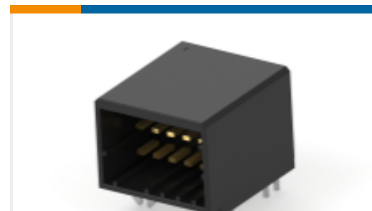
TE 产品编号1-1376137-2 Header Assembly: Wire-to-Board, 5A, gold plated