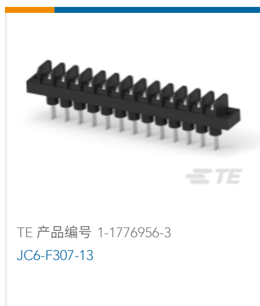
TE 产品编号 1-1776956-3 JC6-F307-13