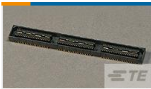
TE 产品编号2-1658012-3 MSB0.80RC-ASY120FL,-,10,-TY