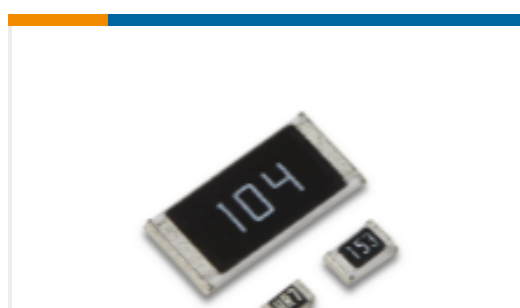
TE 产品编号2176347-6 CRGCQ 2010 27R 1%