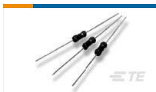
TE 产品编号9-1879352-1 RR02 5% 1K8 AMMO