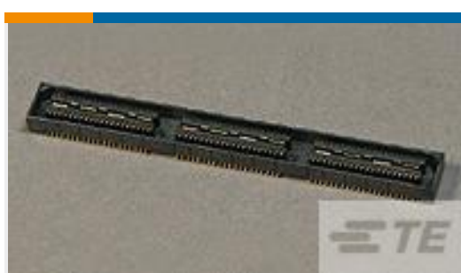
TE 产品编号2-1658012-3 MSB0.80RC-ASY120FL-,10,-TY