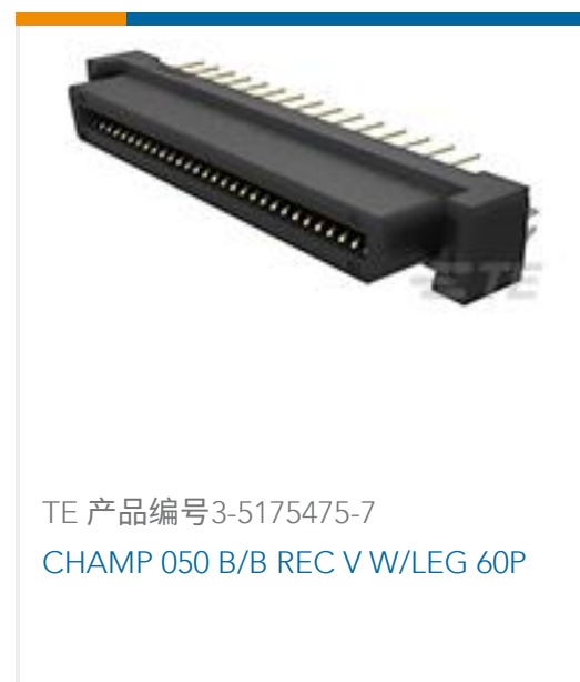
TE 产品编号3-5175475-7 CHAMP 050 B/B REC V W/LEG 60P