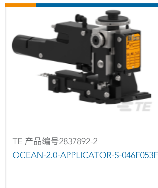
TE 产品编号2837892-2 OCEAN-2.0-APPLICATOR-S-046F053F