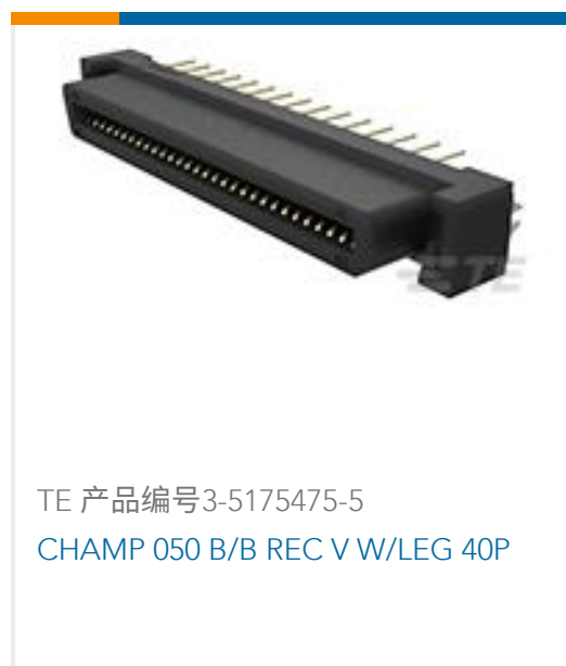
TE 产品编号3-5175475-5 CHAMP 050 B/B REC V W/LEG 40P