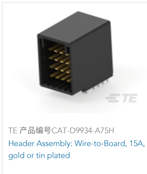
TE 产品编号CAT-D9934-A75H Header Assembly: Wire-to-Board, 15A, gold or tin plated