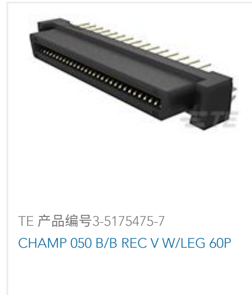
TE 产品编号3-5175475-7 CHAMP 050 B/B REC V W/LEG 60P