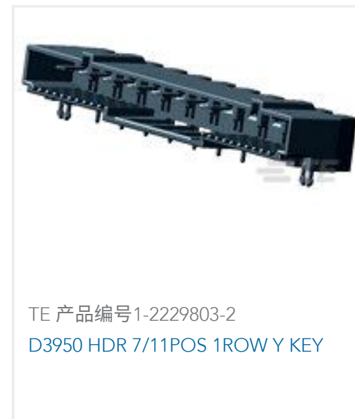
TE 产品编号1-2229803-2 D3950 HDR 7/11POS 1ROW Y KEY