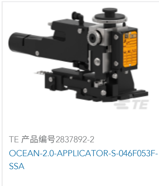
TE 产品编号2837892-2 OCEAN-2.0-APPLICATOR-S-046F053F- SSA