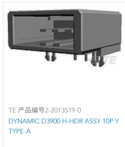
TE 产品编号2-2013519-0 DYNAMIC D3900 H-HDR ASSY 10P Y TYPE-A