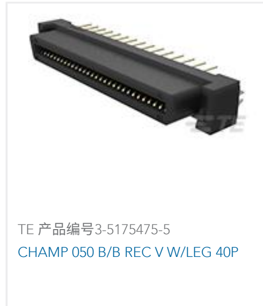
TE 产品编号3-5175475-5 CHAMP 050 B/B REC V W/LEG 40P