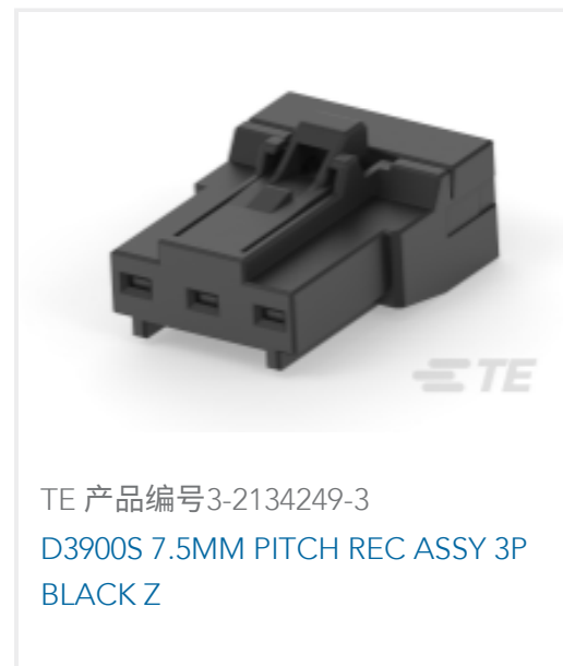
TE 产品编号3-2134249-3 D3900S 7.5MM PITCH REC ASSY 3P BLACK Z