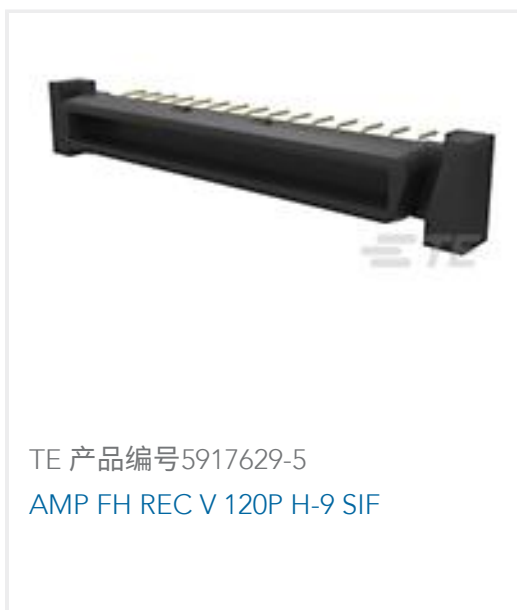
TE 产品编号5917629-5 AMP FH REC V 120P H-9 SIF