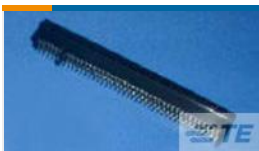
TE 产品编号 1734774-1 PCI EXP 3.1L 36 POS WHT G/F