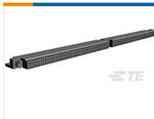
TE 产品编号5533514-6 ASSY,RECPT,R.ANGLE,HDI,LEAD-FR