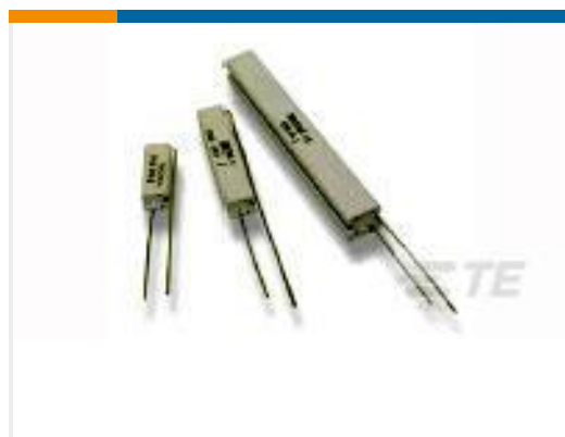
TE 产品编号1-1623726-0 SBCH 6 1R0 5%