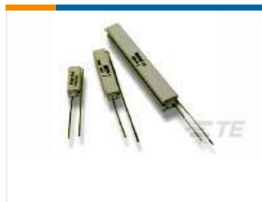
TE 产品编号1-1623726-0 SBCH 6 1R0 5%