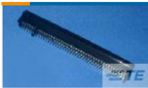
TE 产品编号 1734774-1 PCI EXP 3.1L 36 POS WHT G/F