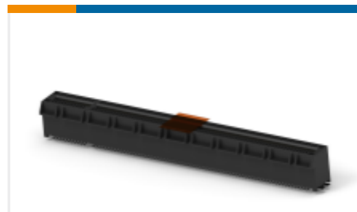
TE 产品编号 5-2337939-4 PCIE GEN4 CON,SMT,164POS,30u", MYLAR,HT