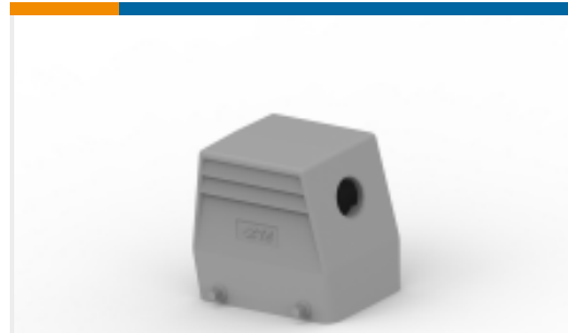
TE 产品编号T1319320120-000 H32A-TS-M20