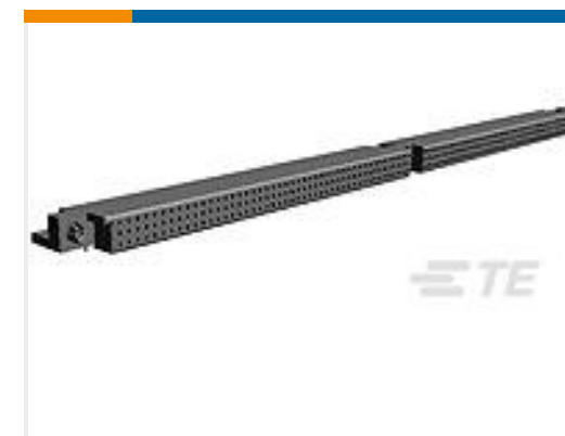
TE 产品编号5533514-6 ASSY,RECPT,R.ANGLE,HDI,LEAD-FR