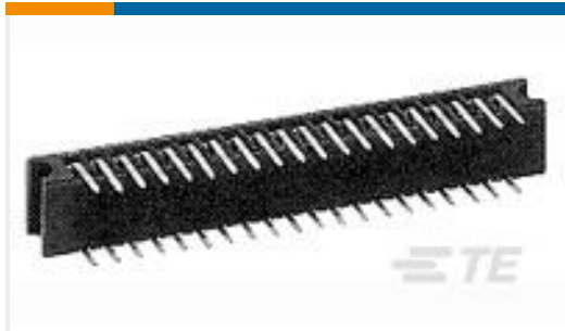
TE 产品编号7-532956-0 130 MODII 2PC CE RCPT ASSY, RoHS