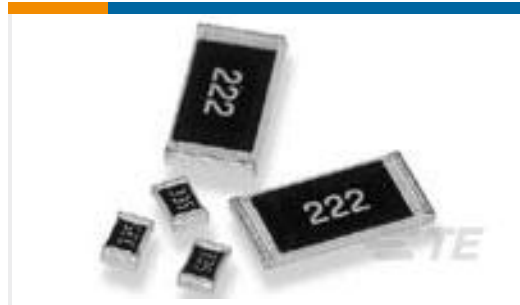
TE 产品编号3-2176067-2 CRG0201 1% 44R2