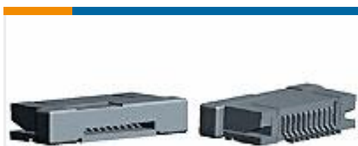
TE 产品编号2-1734592-9 FPC CONN. 0.5MM PITCH B/C, 29P