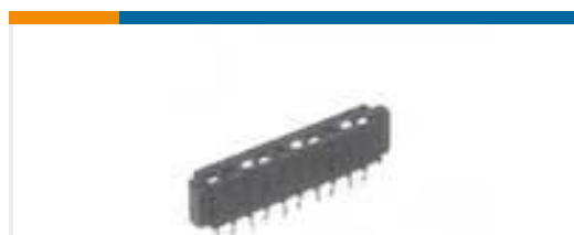
TE 产品编号5-520315-3 TRIOMATE ASSY V 3P L=3.556LDFR