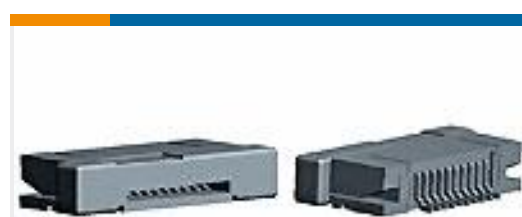
TE 产品编号2-1734592-9 FPC CONN. 0.5MM PITCH B/C, 29P