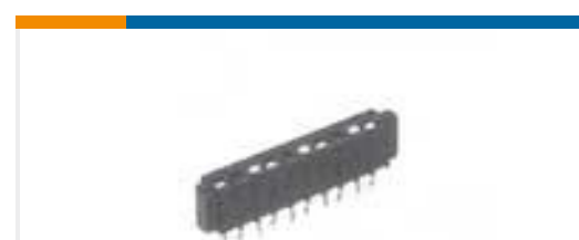
TE 产品编号5-520315-3 TRIOMATE ASSY V 3P L=3.556LDFR