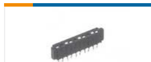
TE 产品编号5-520315-3 TRIOMATE ASSY V 3P L=3.556LDFR