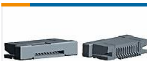
TE 产品编号2-1734592-9 FPC CONN. 0.5MM PITCH B/C, 29P