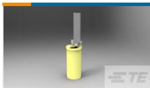
TE 产品编号324543 TAB,PIDG 12-10