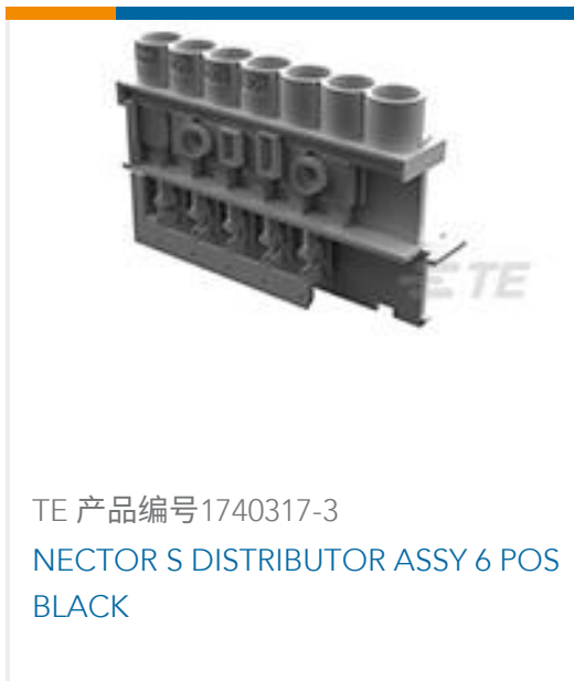
TE 产品编号1740317-3 NECTOR S DISTRIBUTOR ASSY 6 POS BLACK