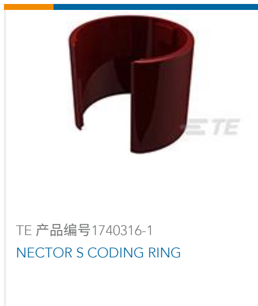
TE 产品编号1740316-1 NECTOR S CODING RING