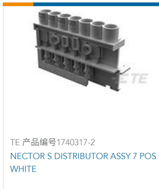
TE 产品编号1740317-2 NECTOR S DISTRIBUTOR ASSY 7 POS WHITE