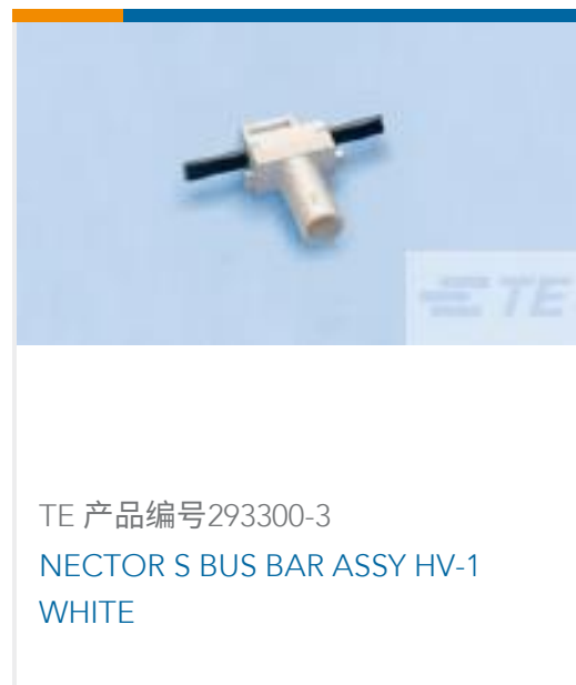
TE 产品编号293300-3 NECTOR S BUS BAR ASSY HV-1 WHITE