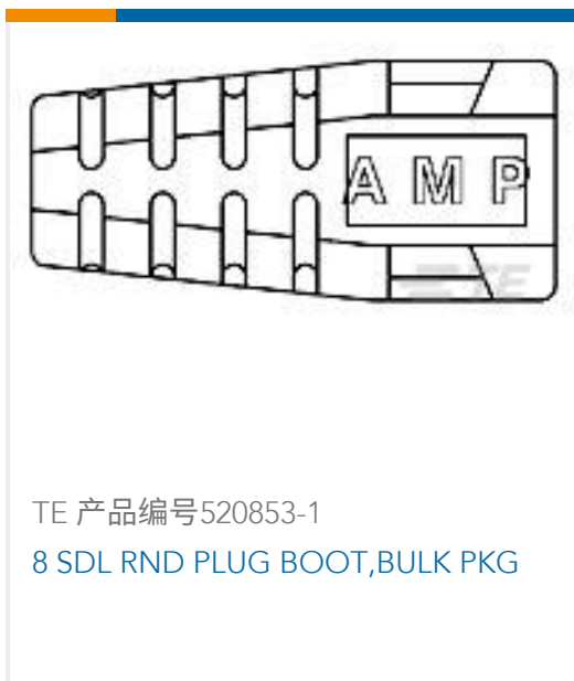
TE 产品编号520853-1 8 SDL RND PLUG BOOT, BULK PKG