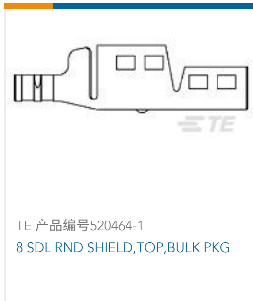
TE 产品编号520464-1 8 SDL RND SHIELD, TOP, BULK PKG