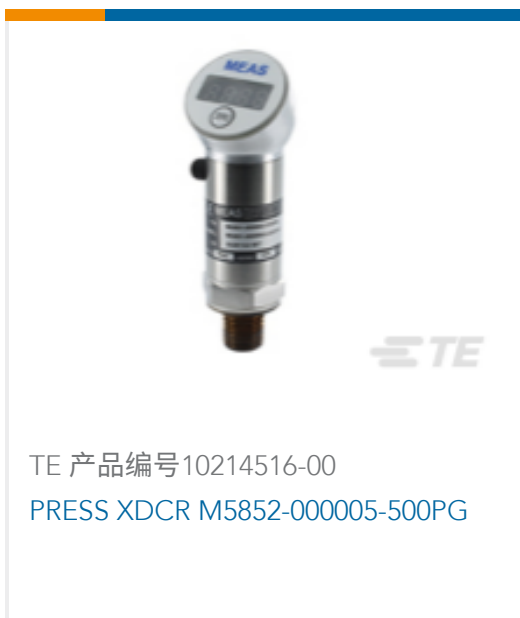
TE 产品编号10214516-00 PRESS XDCR M5852-000005-500PG