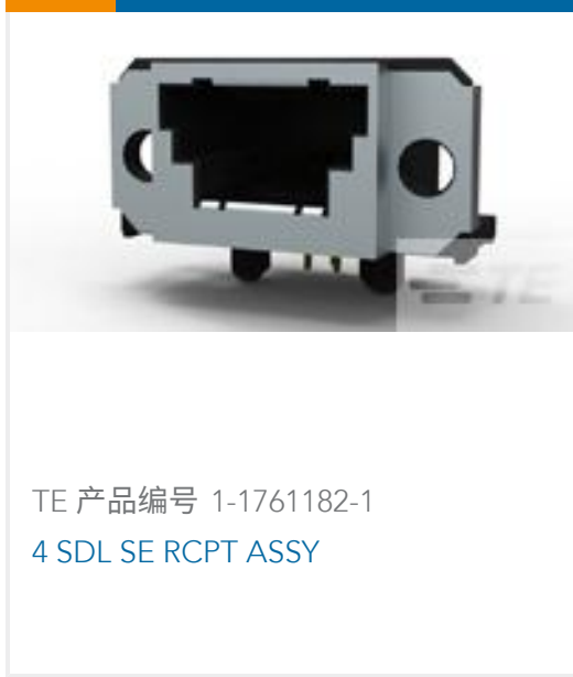
TE 产品编号 1-1761182-1 4 SDL SE RCPT ASSY