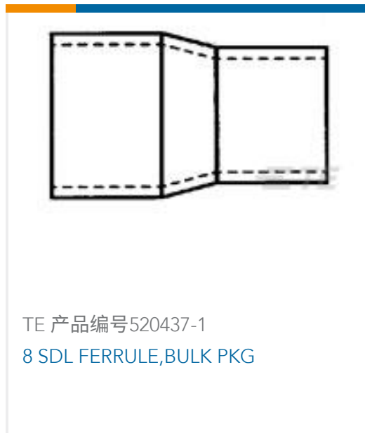
TE 产品编号520437-1 8 SDL FERRULE, BULK PKG