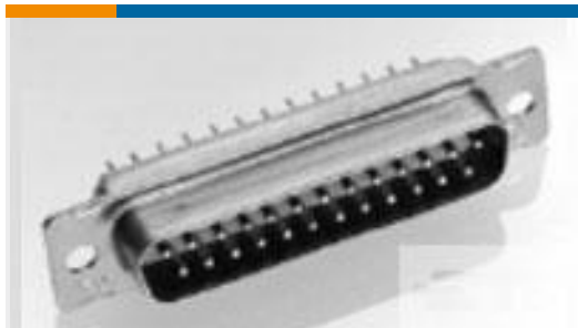
TE 产品编号1-1757823-0 AMPLIMITE,ASY,PLUG,STD,90,ZN,4,CT