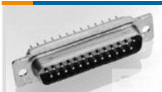
TE 产品编号1757819-2 AMPLIMITE,ASY,PLUG,STD,109,ZN,2