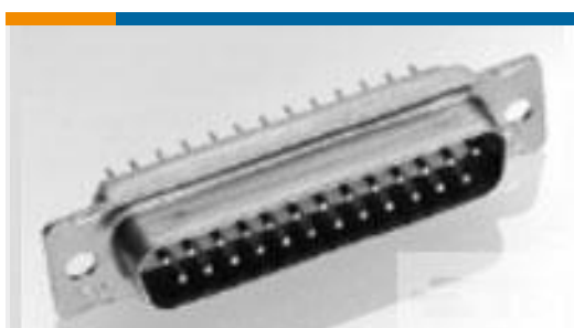
TE 产品编号1757819-3 AMPLIMITE,ASY,PLUG,STD,109,ZN,3