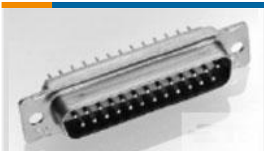
TE 产品编号1757819-5 AMPLIMITE,ASY,PLUG,STD,109,ZN,5