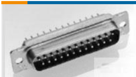
TE 产品编号1757823-2 AMPLIMITE,ASY,PLUG,STD,90,ZN,2