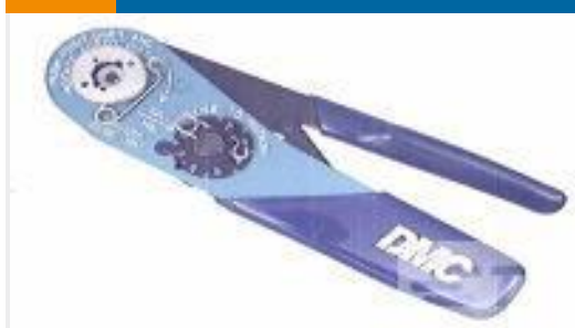
TE 产品编号 601966-1 CRIMPING TOOL M22520/2-01