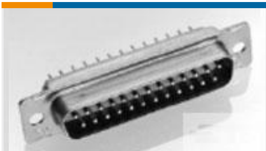
TE 产品编号1757820-1 AMPLIMITE,ASY,RCPT,STD,109,ZN,1