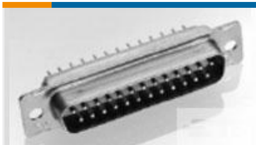
TE 产品编号1-1757820-0 AMPLIMITE,ASY,RCPT,STD,109,ZN,5,CT