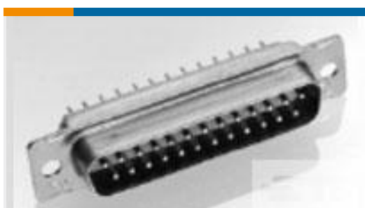
TE 产品编号1757819-4 AMPLIMITE,ASY,PLUG,STD,109,ZN,4