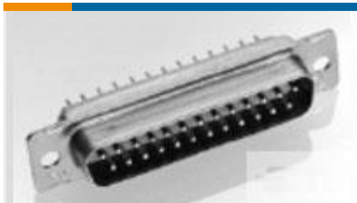
TE 产品编号1757824-2 AMPLIMITE,ASY,RCPT,STD,90,ZN,2