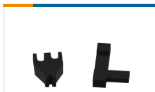
TE 产品编号1-1752356-7 SUPPORT, TERMINAL