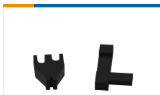
TE 产品编号1-1752356-6 SUPPORT, TERMINAL