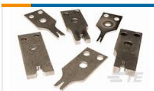
TE 产品编号2-1490019-3 CRIMPER, WIRE (.050" 'F)