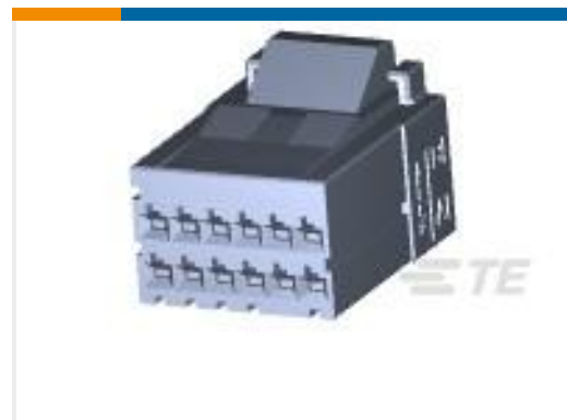
TE 产品编号1-1318118-6 DYNAMIC D-2100 REC HSG 12P