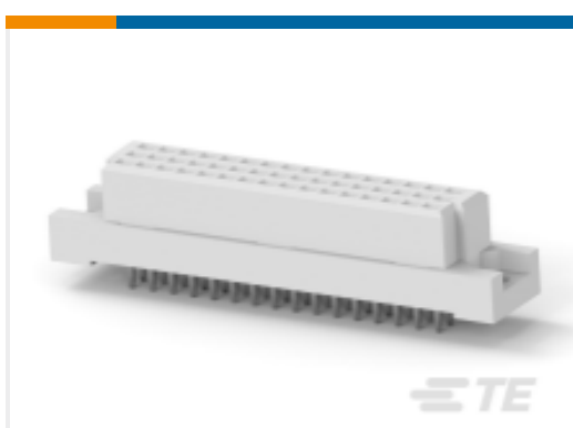
TE 产品编号4-2271908-0 CELLO,REC,48P,TH,V,FG,DIP3.0,-