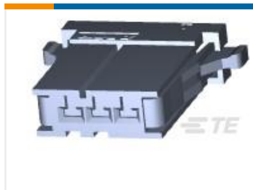
TE 产品编号1-178288-3 DYNAMIC DD3100 REC HSG 3P (SGL)