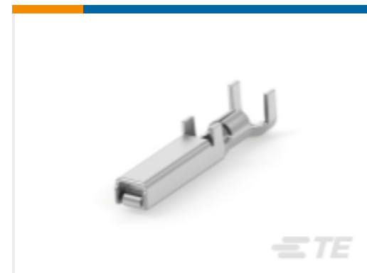
TE 产品编号1-353715-2 Contact: Component To Wire; 15A, 28-14 wire size