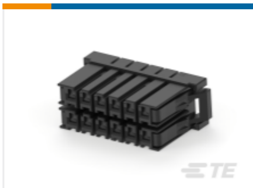
TE 产品编号2-178128-5 Receptacle and Tab Housing: 5.08 mm Pitch, 250-600V