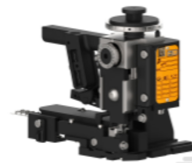
TE 产品编号 2151080-1 OCEAN_2.0_APPLICATOR-S-062F110F Series