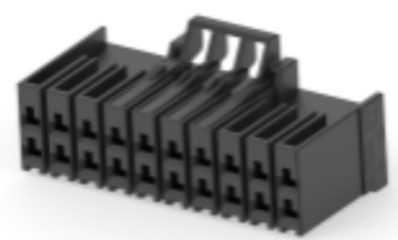
TE 产品编号 CAT-D9934-A75C Dynamic 3500 母端和公端壳体