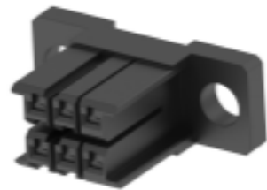
TE 产品编号 1-917266-3 DYNAMIC D-3200 P/MOUNT REC HSG