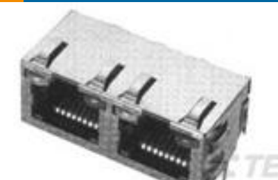
TE 产品编号6116353-5 INV MJ,1X2,PNL GRD,LED (G/G)