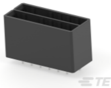
TE 产品编号3-178139-2 Header Assembly: Wire-to-Board, 15A, gold or tin plated