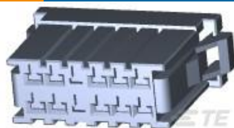
TE 产品编号178289-6 DYNAMIC 3100 REC HSG 12P DBL