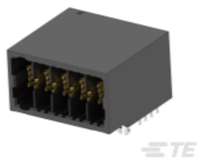
TE 产品编号 1-1747145-5 DZ5200 H-HDR ASSY 5P 5.08MM PITCH