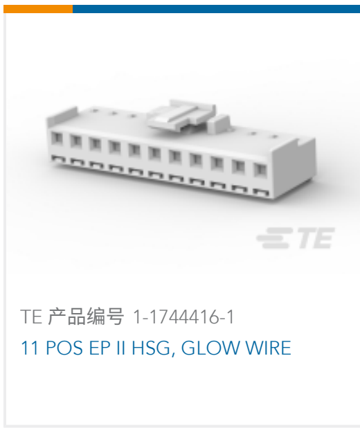
TE 产品编号 1-1744416-1 11 POS EP II HSG, GLOW WIRE