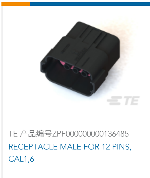
TE 产品编号 ZPF000000000136485 RECEPTACLE MALE FOR 12 PINS, CAL1,6