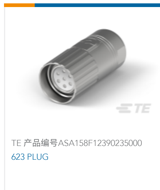
TE 产品编号 ASA158F12390235000 623 PLUG