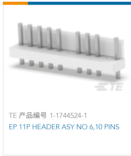
TE 产品编号 1-1744524-1 EP 11P HEADER ASY NO 6,10 PINS