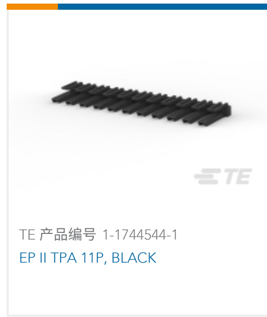
TE 产品编号 1-1744544-1 EP II TPA 11P, BLACK