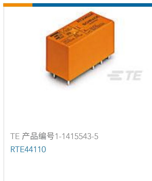
TE 产品编号 1-1415543-5 RTE44110