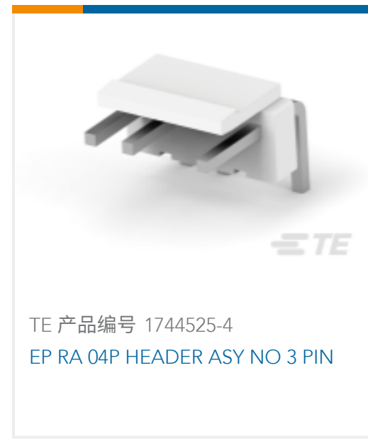
TE 产品编号 1744525-4 EP RA 04P HEADER ASY NO 3 PIN