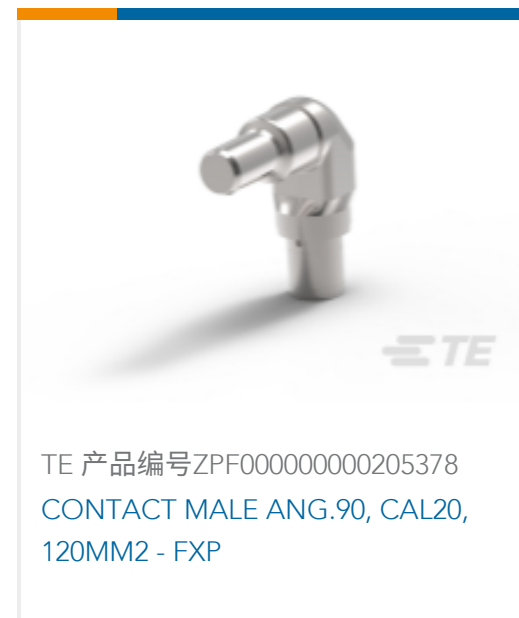
TE 产品编号 ZPF000000000205378 CONTACT MALE ANG.90, CAL20, 120MM2 - FXP