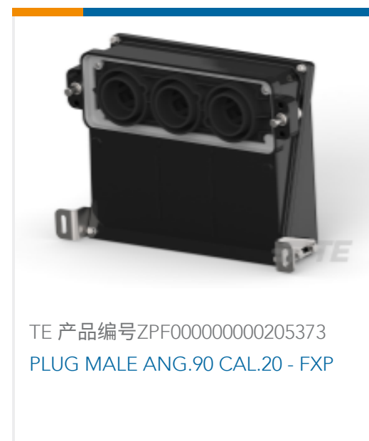
TE 产品编号 ZPF000000000205373 PLUG MALE ANG.90 CAL.20 - FXP