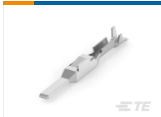
TE 产品编号2109005-3 060 TAB(M) CONT