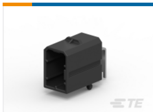
TE 产品编号2219678-1 MCP 9.5MM CAP 2P ASSY EXP