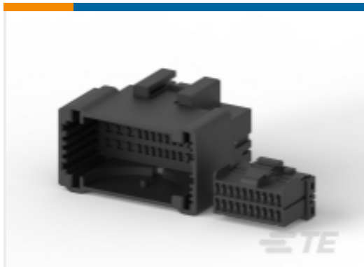
TE 产品编号1-1743611-2 MULTILOCK, 连接器壳体