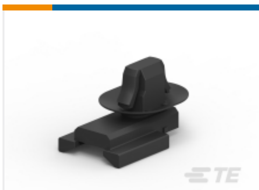
TE 产品编号2005534-2 SLOT CLIP FOR LIF CONNECTOR