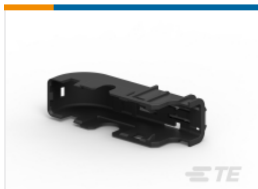
TE 产品编号2219215-1 HYB SLD 38P COVER ASSY