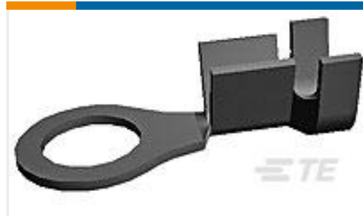
TE 产品编号40696 RING TERMINAL 12-10 AWG TPBR