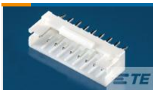
TE 产品编号 1-1735446-4 2MM PITCH HPI POST HEADER, VERTICAL, 14P